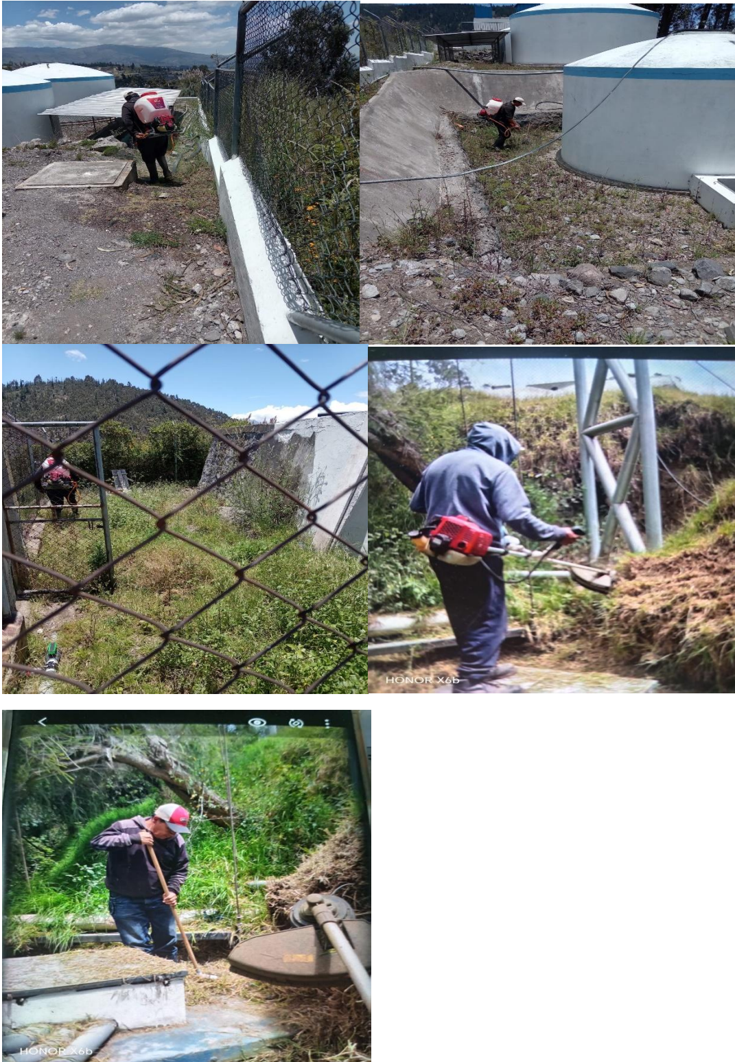
Reparación e impermeabilización del tanque de agua de la Florida