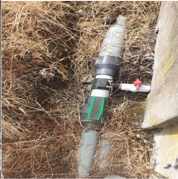
Verificación del caudal de Agua y recorrido por las fuentes.